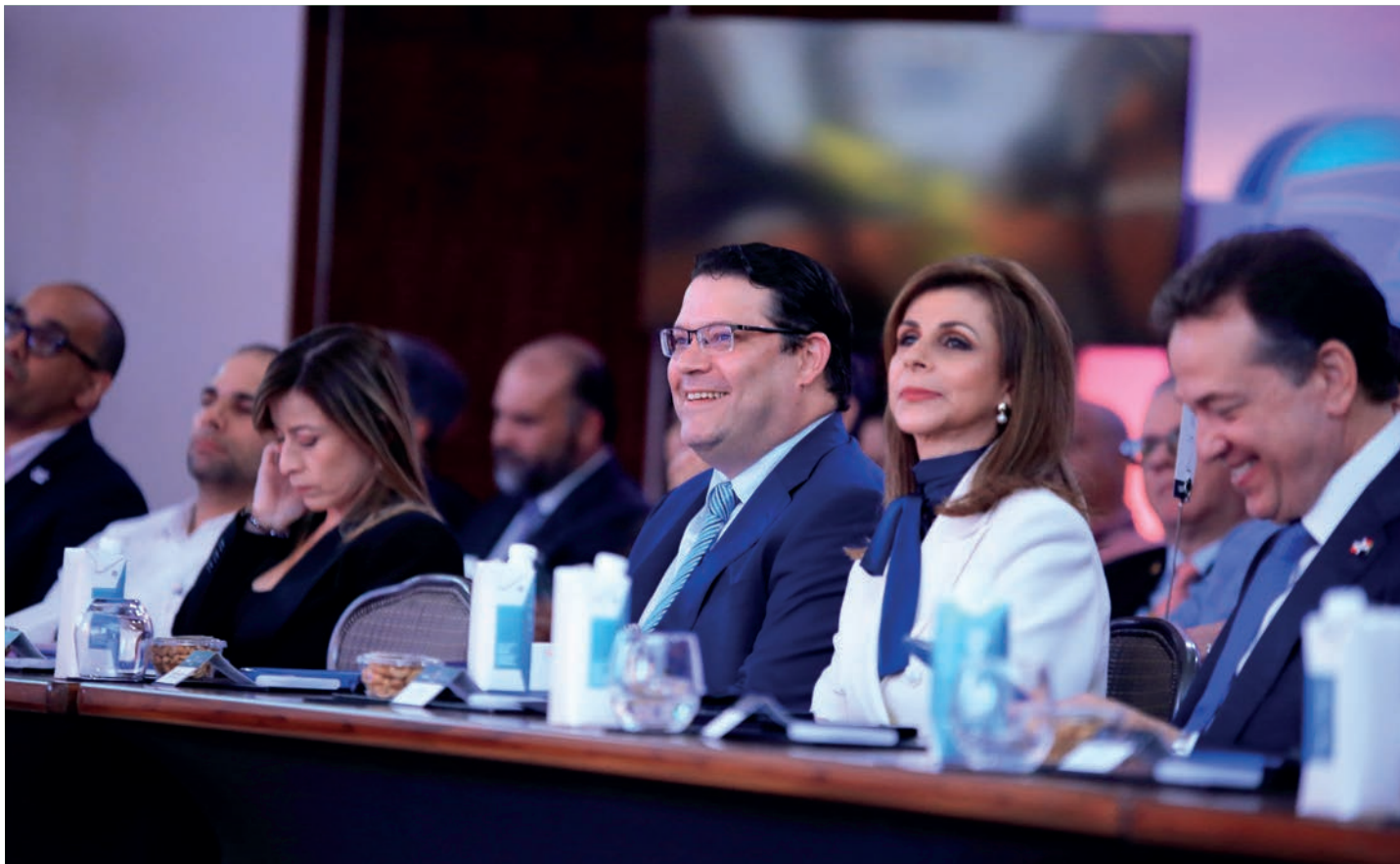
En amena camaradería se dio la conferencia “Transporte logística & Zonas Francas”, en el Summit 2023.