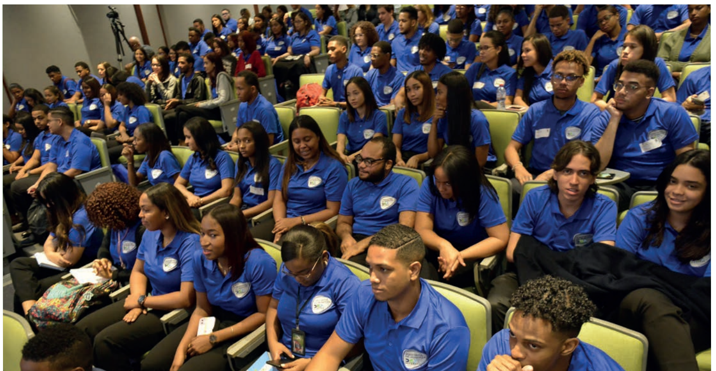
Los nuevos jóvenes que entran al programa “Pasantía DGA”, estarán laborando en distintas áreas.