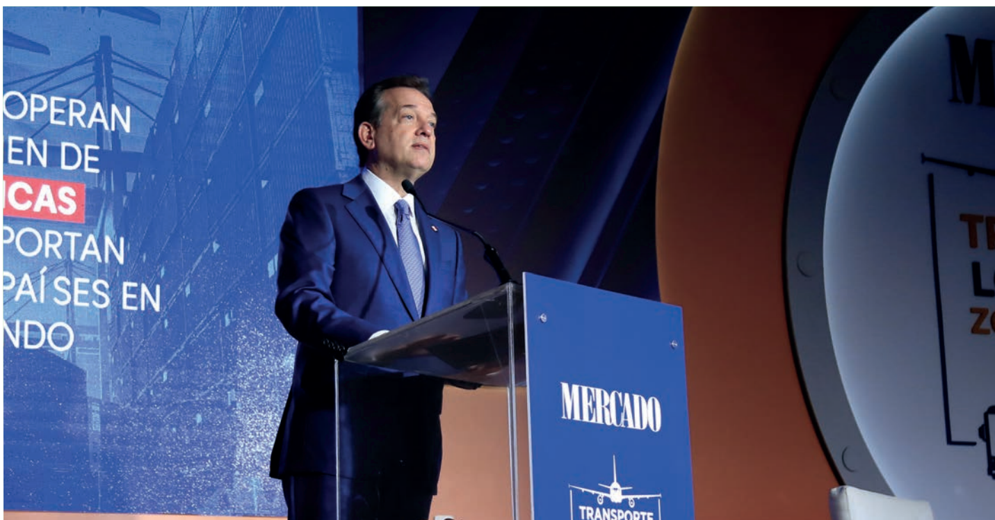
Víctor Ito Bisonó, ministro de Industria, Comercio y Mipymes, también estuvo de invitado en la conferencia.