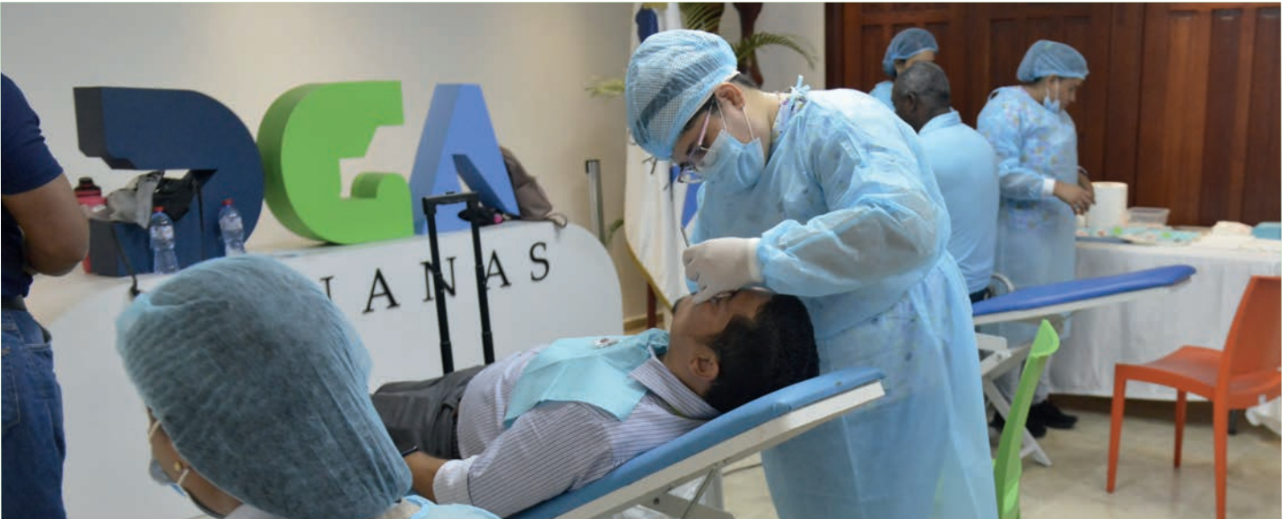
Los operativos, odontológicos y oftalmológicos, estuvieron bastante concurridos por colaboradores que obtuvieron los servicios.