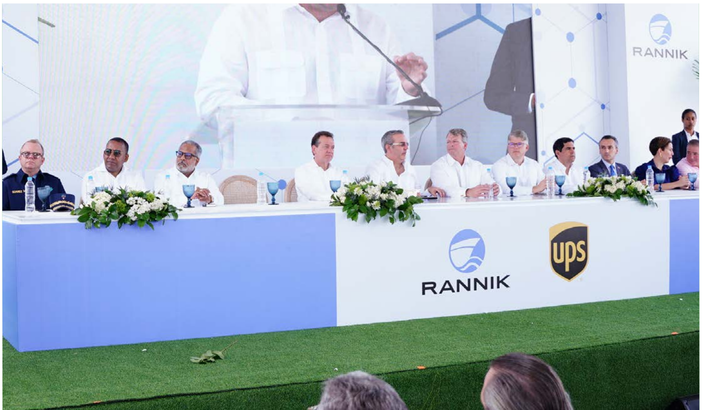
El presidente de la República, Luis Abinader, encabezó, junto a empresarios, la inauguración del almacén Rannik.