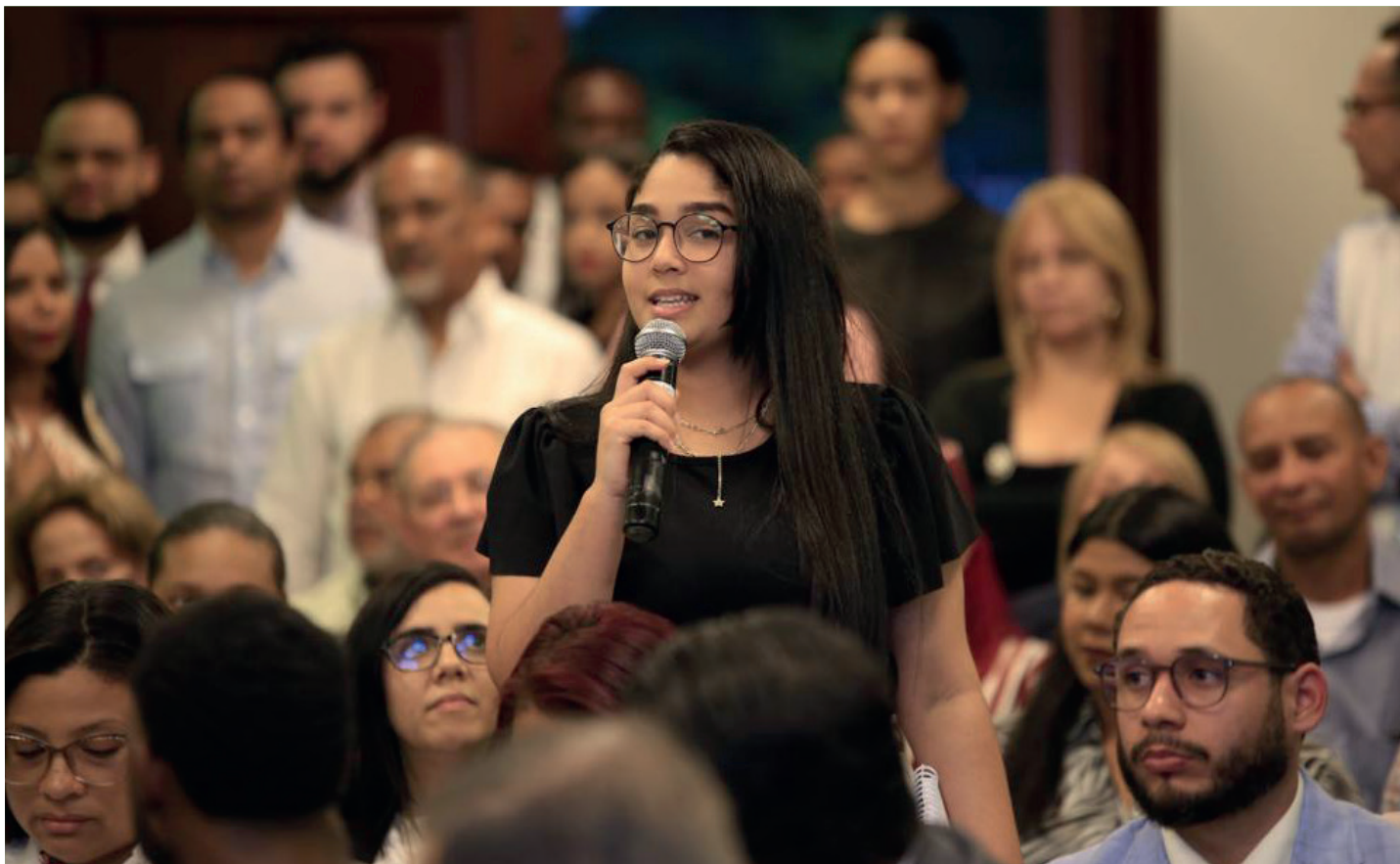
Entusiasmados, los estudiantes hicieron preguntas sobre los temas tratados en la actividad.