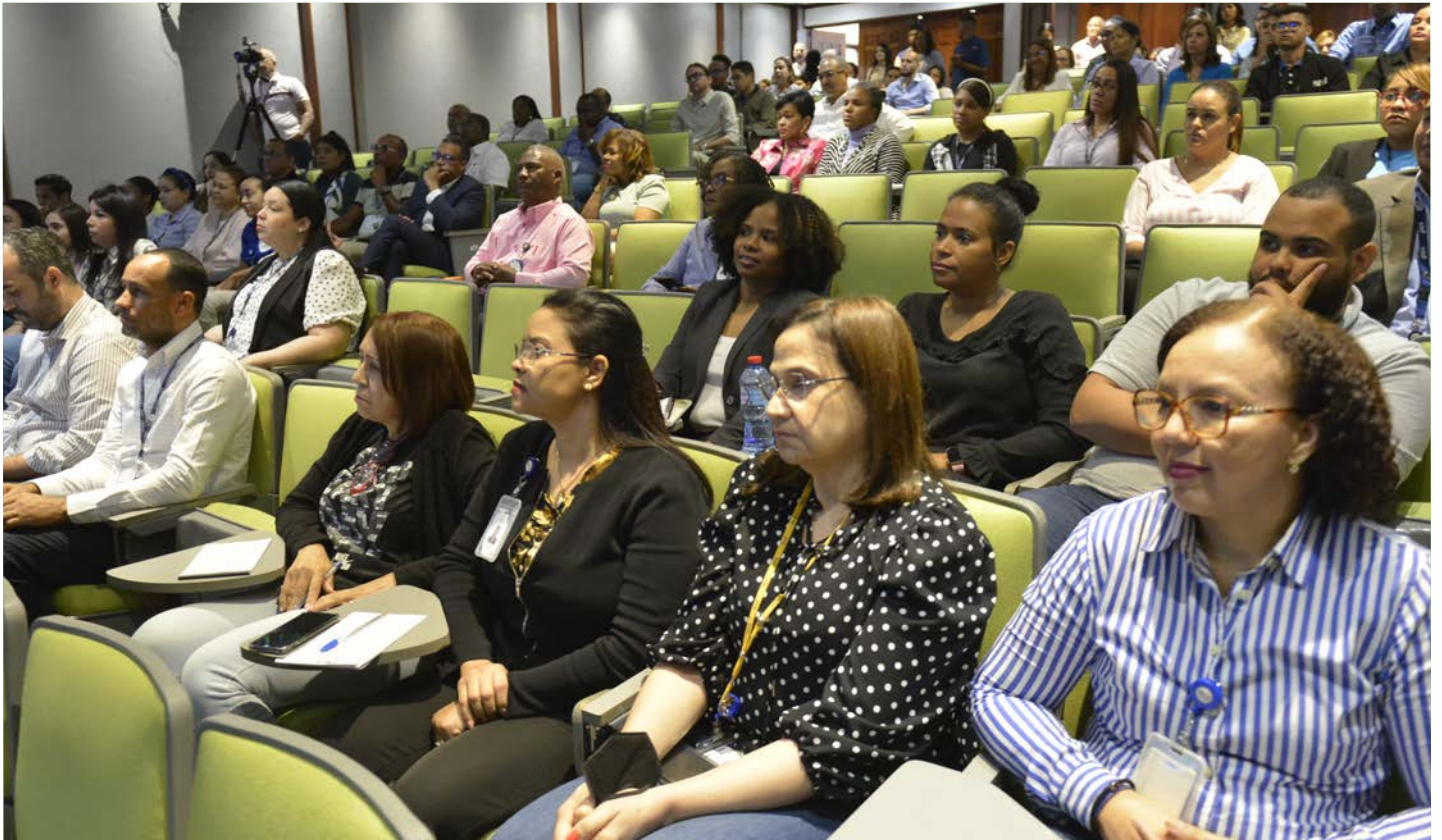
Los colaboradores de la DGA estuvieron atentos a la conferencia sobre “Cumplimiento e integridad en la administración pública”.